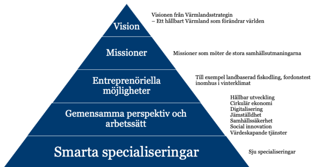
Figur 1: Genomförandet av Värmlands forsknings- och innovationsstrategi för hållbar smart specialisering 2022–2028

Utgångspunkten för strategin för smart specialisering är Värmlandsstrategins vision om ett hållbart Värmland som förändrar världen. Specialiseringsstrategin ska särskilt bidra till målområdet konkurrenskraft. För att kraftsamla insatserna har sju smarta specialiseringsområden valts ut. Utöver detta innehåller strategin missioner, nya större entreprenöriella möjligheter och gemensamma perspektiv och arbetssätt som ska vara vägledande för genomförandet.